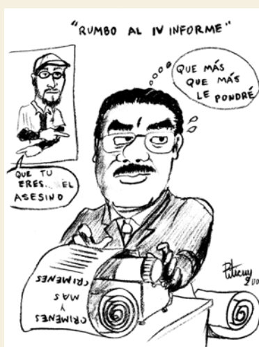
Picuty. Luchador social oaxaqueño, especialmente en el magisterio democrático, hoy en Todos Somos APPO. Pertenece a una familia que desde sus abuelos ha resistido y luchado en contra de la represión. Desde hace más de 20 años sus cartones han sido publicados en diversos medios y generosamente nos ha enviado algunos para colaborar en FNCREMOS.

Las personas y organizaciones integrantes del FNCR nos solidarizamos con su lucha e invitamos a todos los deudores del INFONAVIT a organizarse por la defensa de nuestro patrimonio familiar y en contra de los abusos del capital privado, en base a uno de los derechos humanos fundamentales como es el derecho a la vivienda. Así mismo, manifestamos nuestro beneplácito por la iniciativa de coordinar, a nivel nacional, el movimiento urbano.