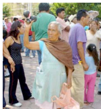
Una compañera asistente a la Asamblea Constitutiva del FMCR muestra los cascos de las granadas que fueron usados por ejército en los ataques a los Pueblos de Amayuca y Xoxocotla.

VIII Asamblea Nacional del FNCR el día sábado 6 de diciembre de 2008 en el auditorio de la Escuela Primaria de Amayuca, Morelos.