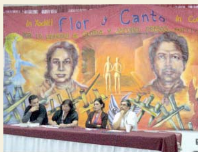
Presidium de la Asamblea Constitutiva del FMCR, La libertad de los presos y de los desaparecidos políticos es una demanda permanente del FNCR a nivel nacional y en cada uno de los Estados.

Además, al haberseles aumentado las penalidades por rebelión y daño en propiedad ajena a once años siete meses, y dos años siete meses, respectivamente, se les juzgó dos veces por los mismos delitos, ya que se modificó una pena que ya estaba compurgada desde el 22 de octubre de 2004.